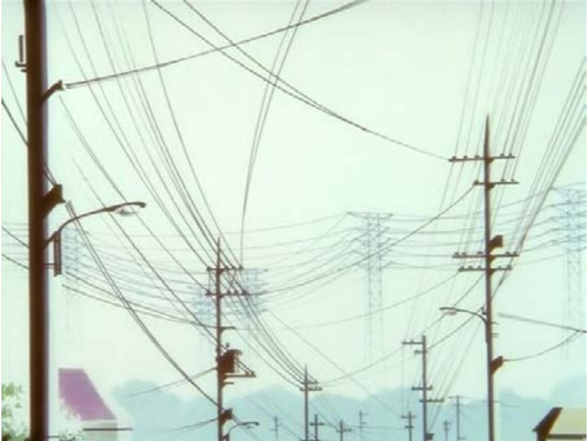
Image : Yoshitoshi Abe, Serial Experiments Lain (extrait), 1998