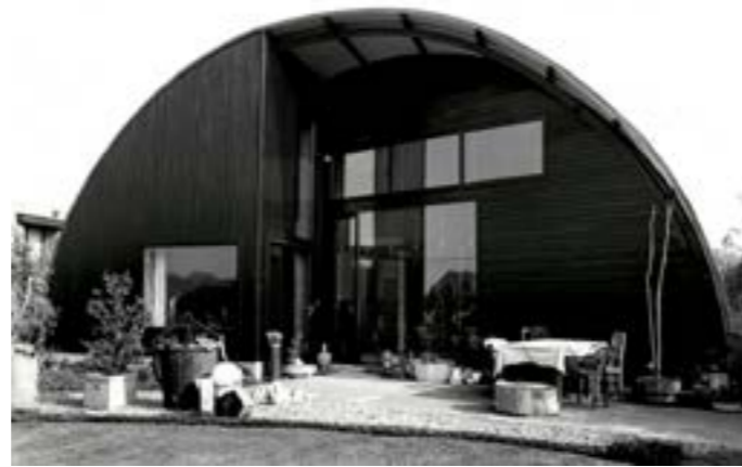
De Smet Vermeulen architecten, Woning K te Z , 1990

En complément à ce travail individuel, un séminaire bis sera également proposé en vue d'approfondir, le cas échéant, des points évoqués individuellement ou collectivement lors du séminaire général.