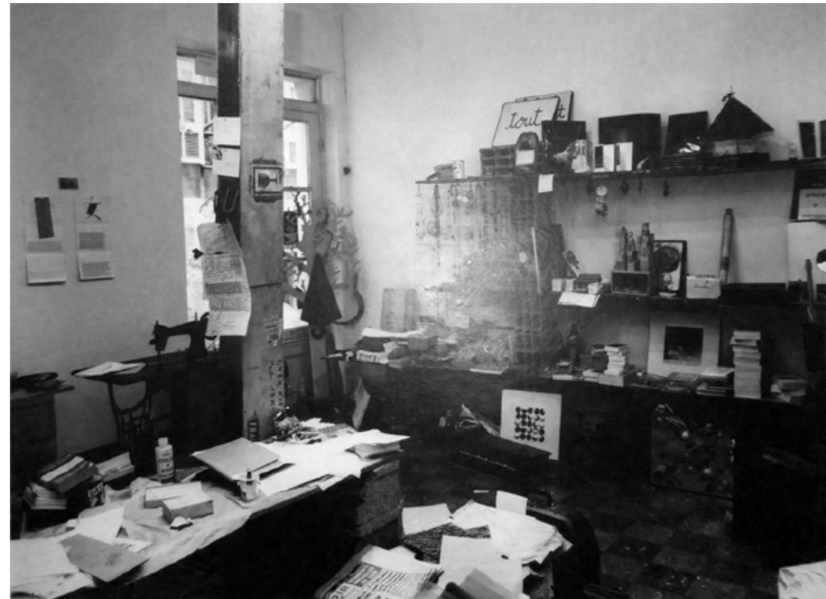
Robert Filliou, la Non École de Villefranche-sur-mer