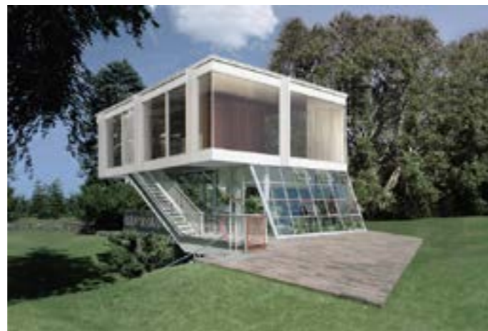
Baukunst, House on a slope , 2007