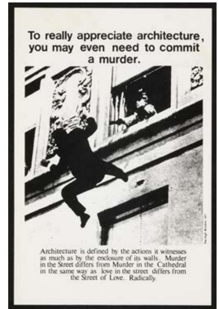
Bernard Tschumi, Advertisements for Architecture , 1976-1977

Cet ensemble pédagogique entend ainsi - conforter les connaissances des étudiant.e.s en matière d'histoire et de théorie contemporaines de l'architecture ; - conforter les connaissances des étudiant.e.s en matière de culture architecturale belge ; - offrir un cadre pédagogique propice à l'apprentissage de l'écriture sur l'architecture ; - plus fondamentalement, ouvrir les étudiant.e.s à l'apprentissage de l'architecture dans ses multiples dimensions, envisagée à la lumière des humanités architecturales ; - ouvrir les étudiant.e.s aux recherches épistémologiques liées à la constitution de savoirs renouvelés sur l'architecture, à travers les outils de réflexivité que sont les approches diachroniques et historiques de la discipline ; - soutenir les étudiant.e.s dans leur capacité à développer un regard critique et théorique face à la production architecturale à laquelle ils et elles sont (et seront) quotidiennement confronté.e.s.