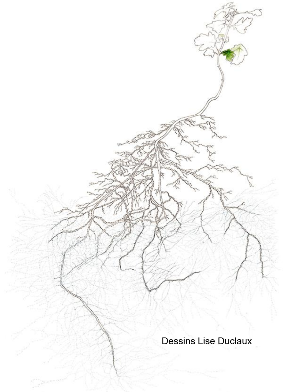
Dessins Lise Duclaux