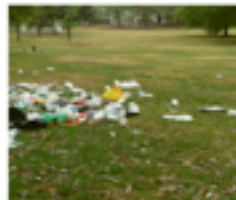
PROPRETÉ ET SÉCURITÉ