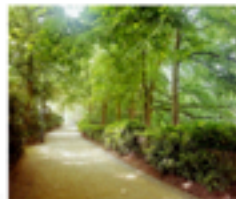
LES ESPACES PUBLICS