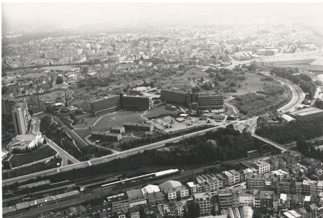
Campus de La Plaine, 1975