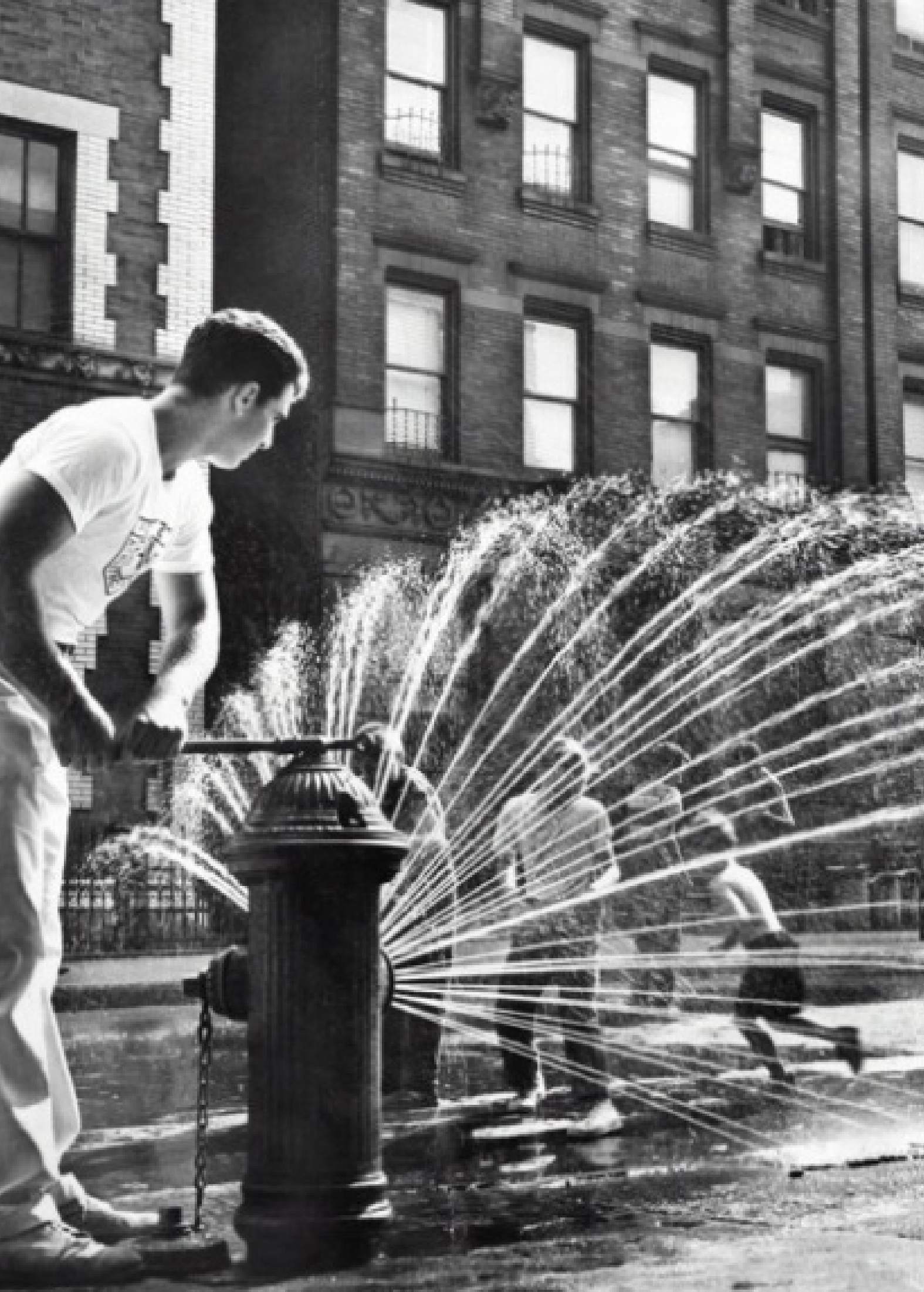
Children playing in front of a fire hydrant opened by Police Athletic League, 1960. New York

Workshop adapté aux étudiant.es ayant des sensibilités au design urbain et à l'ingénierie, une bonne observation et analyse urbaine, des prédispositions aux travaux manuels et un peu d'expérience dans l'événementiel.