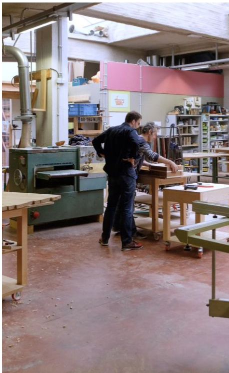
Wood in Molenbeek