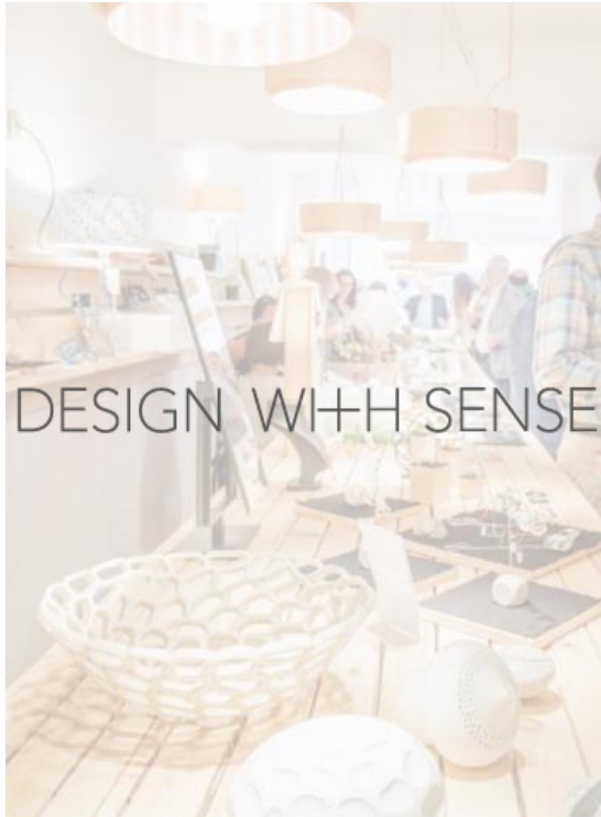
Design with Sense