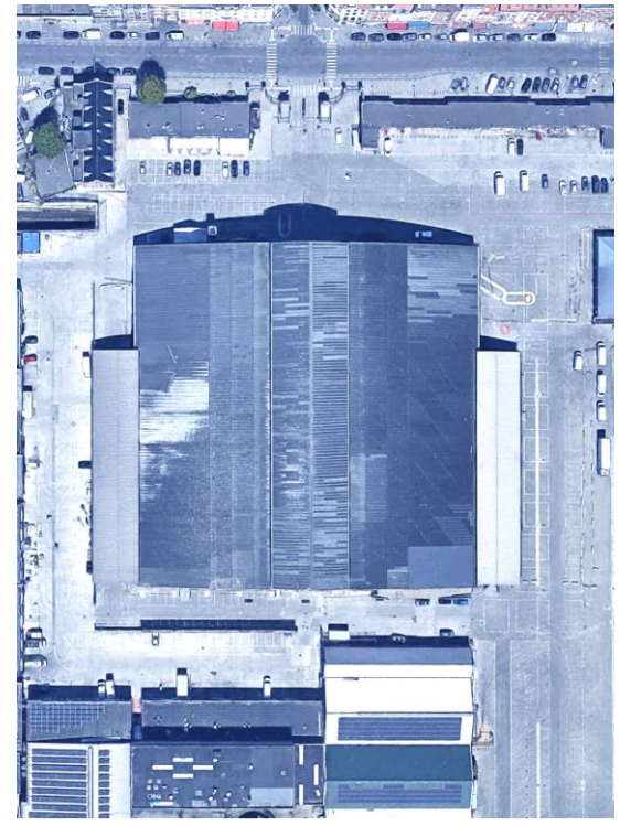
LA PLAINE ABATTOIR