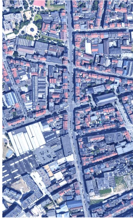
CHAUSSEE DE MONS